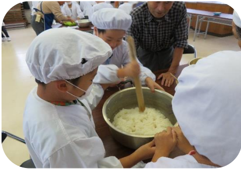
(ぺったん、ぺったん、ぺったんこ)