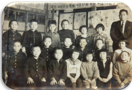
昭和30年の中川小蔵王分校児童。 小生（中段右から2人目）は襦袢を着ている。