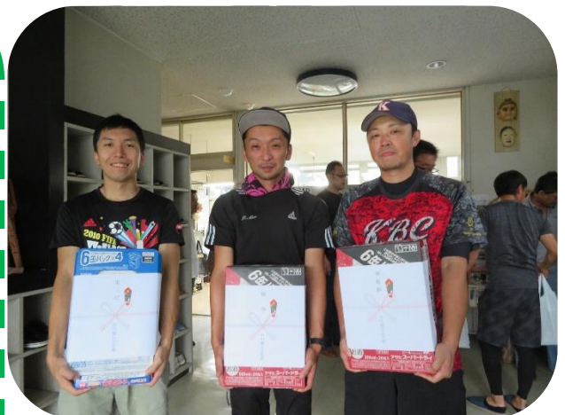
運も実力のうちっす